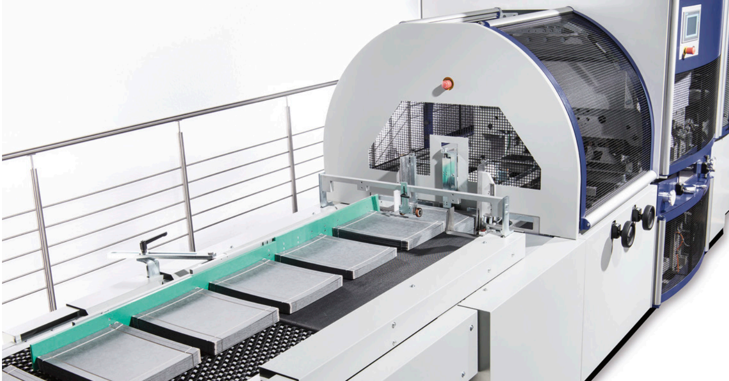
Einfuhr CP 500 mit kreuzgenuteten Pappen