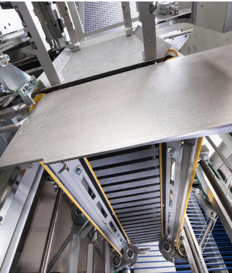
Box Line Former BLF 500, Aufricht- und Formstation