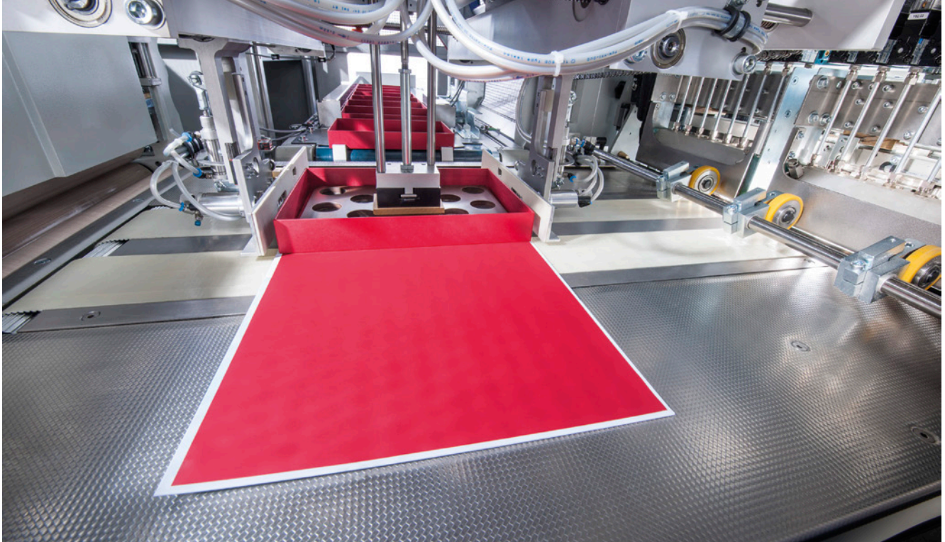
Aufsetzmodul für Schachteln, Typ Box Placer BP 500